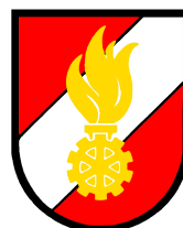
Freiwillige Feuerwehr Gmünd