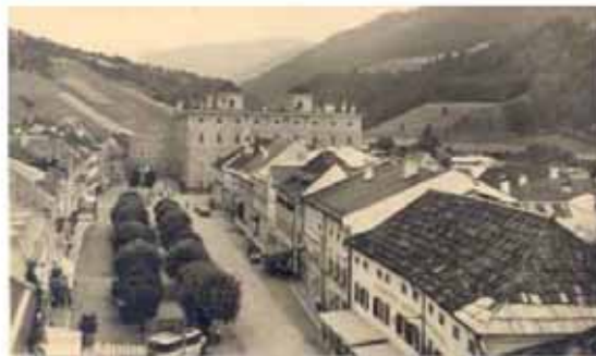
Das Schloss vor 1940. Erst 1941/42 wurde im Oberen Tor der zweite Durchgang geöffnet.