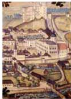
Das Schloss zur Zeit der Raitenauer. Rechts der Kapellenanbau, den die Lodron umgebaut haben. Auch die zweite Schneckenstiege ist erst von den Lodron erbaut worden.