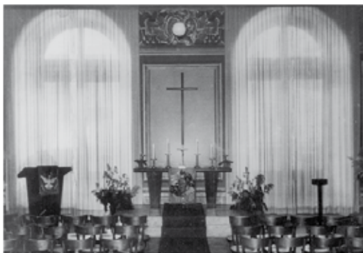
Die evangelische Pfarrgemeinde hatte eine Zelt lang im Schloss ihren „Betsaal“.

Nach dem Besuch der Gegenreformationskommission in Gmünd (im Jahre 1600) waren sowohl Kaiser Rudolf II. als auch der Erzbischof in Salzburg daran interessiert, dass es zu keinem Rückfall in den Protestantismus in den Salzburger Besitzungen kommt. Erzbischof Wolf Dietrich von Raitenau hatte zu diesem Zweck schon seinen jüngsten Bruder Rudolf als Verwalter nach Friesach geschickt. Mit der Einwilligung des Kaisers konnte dieser die Herrschaft Gmünd von den evangelisch gebliebenen Khevenhüllern übernehmen und kam so „zur Bewahrung der katholischen Religion“ nach Gmünd. Hier wollte er wohl seinem erzbischöflichen Bruder im Lebensstandart um nichts nachstehen und begann am Hauptplatz mit dem Neubau eines standesgemäßen Schlosses. Einige Bürgerhäuser mussten abgerissen werden, um für das „Newgebäu“ Platz zu schaffen.