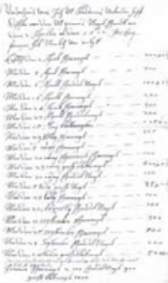
Eine Aufzählung von 3800 Nägeln, die für den Schlossbau 1612 geliefert wurden.

erkaufte Zainersche Haus niedergerissen und neu aufgebaut, 1612 und 1613 baute Meister Deutte an der Pfarrkirche, 1613/14 arbeitete Deutte an der alten Burg. 1641 beauftragt ihn Gräfin Maria Sidonia v. Raitenau, die Raitenau-Kapelle zu bauen und 1648 bessert er Verschiedenes am hiesigen Stadtpfarrhaus, errichtet auch die Gartenmauer.