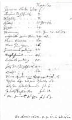
Das Register der Bauaufzeichnungen vom Jahre 1607. Hier wurde für jeden Handwerker eingetragen, wie viele Schichten er gearbeitet hat und welchen Lohn er dafür erhielt.