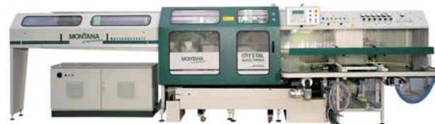
Schleifroboter – Modular (MAS 2000 GGB HTT)

Modernste Robotertechnik für den perfekten Ski- & Boardservice im Haus